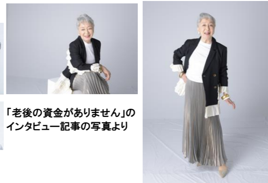
「老後の資金がありません」のインタビュー記事の写真より